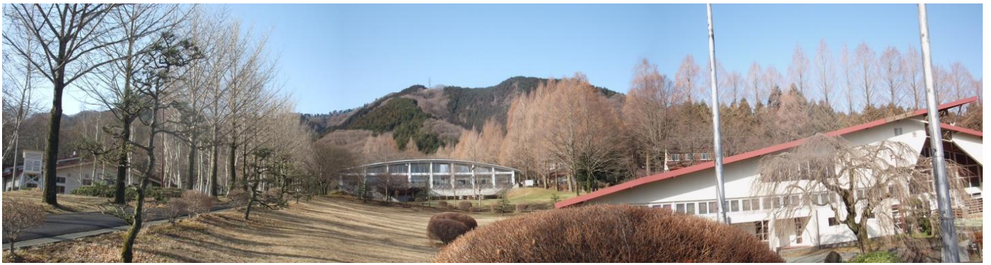
愛川ふれあいの村3月の風景