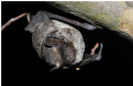
冬眠から覚めたイエコウモリの雄