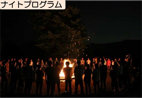
ナイトプログラム