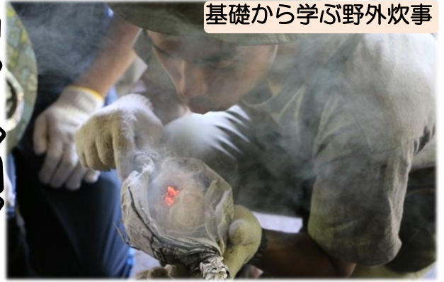
基礎から学ぶ野外炊事