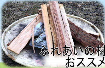
ふれあいの村 おススメ

子どもたちと一緒に活動をするとき、どんな薪の組み方をしますか？ 火種は、マッチ？チャッカマン？そのあとに着火するのは、新聞紙？割りばし？牛乳パック？