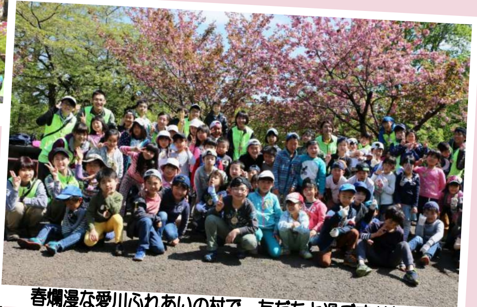
春爛漫な愛川ふれあいの村で、友だちと過ごす1泊2日