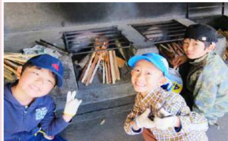
みんなで協力して作る“野外炊事”