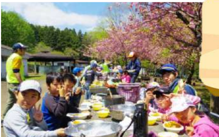
自分たちで作ったご飯はとってもおいしい!