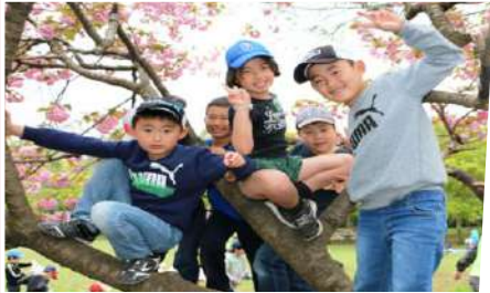
春爛漫な愛川ふれあいの村