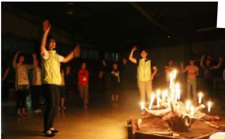
キャンドルの灯りの下、歌って踊る“特別な夜”