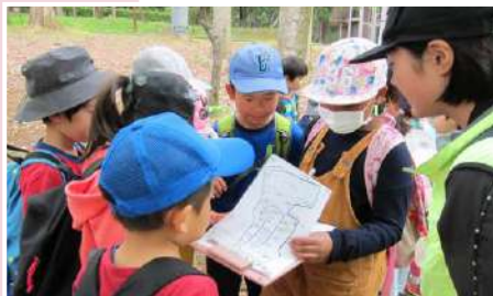
班のみんなで力を合わせて進む“村内ラリー”