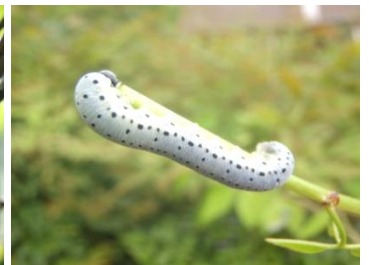
アビコンボウバチの幼虫