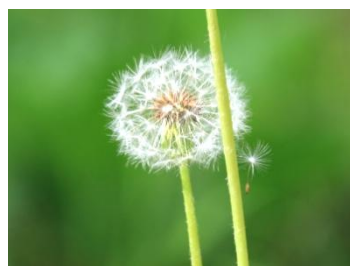
かたつんぽの綿毛