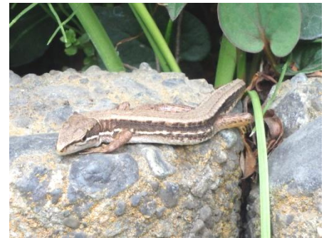
日向ぼっこをするカナヘビ