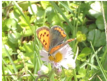
ヒメジョオの蜜を吸うベニツグミ