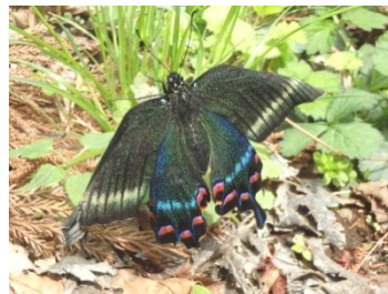
羽を乾かすカラスアゲハ