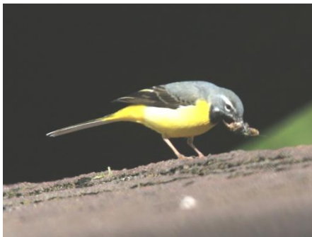
雛へ餌を運ぶキセキレイ

蝶は舞い、鳥は歌います。一方ではまだイモムシや雛が大空をおもむ頃でもあります。親鳥は雛のもとへせっせと餌を運ぶ姿も見られるようになりました。新しい命の誕生と成長を感じる5月。木々の緑も一層深くなり、春から夏へと季節の移ろいを感じます。