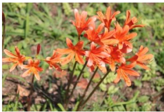
キツネノカミソリ