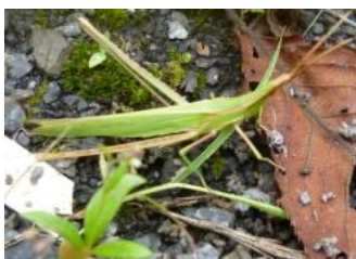
ショウリョウバッタ