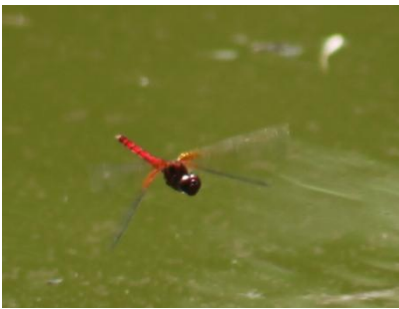
元気に飛ぶツヨクガヨウトボ

今年の夏は猛暑日が多く、スポーツ活動等では水分の補給が大変でした。草花や、虫たちはこの暑さの中でも元気に活動をしていました。水辺で飛び交うトンボたち、クヌギやコナラに集まるクワガタムシ、樹液を吸っているアブラゼミ等、皆たくましく元気にこの夏を過ごしていました。