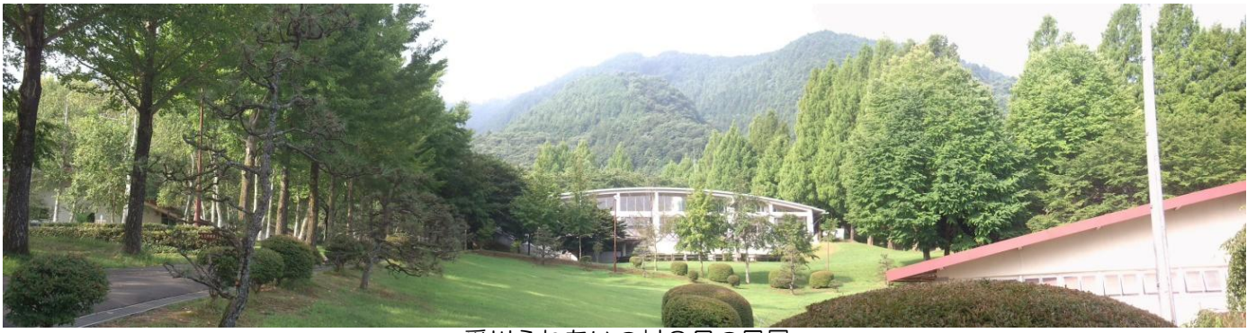
愛川ふれあいの村8月の風景