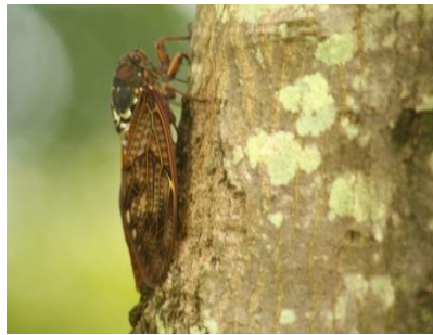
木の汁を吸っているアブラゼミ