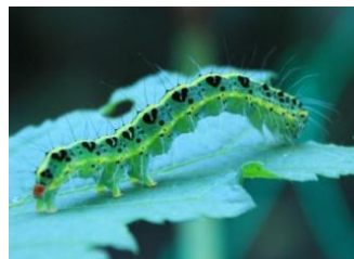
フクラスズメの幼虫