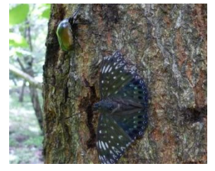
スミナガシとカナブン