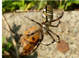
朽木を食べているカガクガ