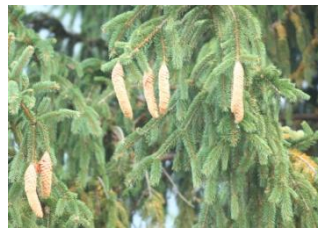
ドイツ杉の球果(カマ)