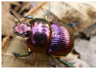
オオセンチコガネ