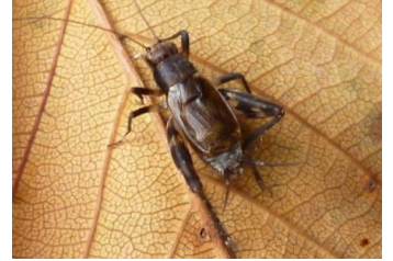
小さな虫マダラスズ