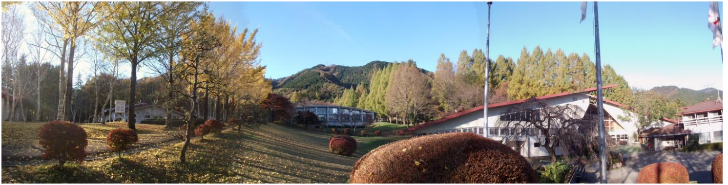
愛川ふれあいの村 11月の風景