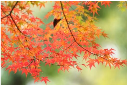
色づいてきたイロハモミジ

<11月の自然のエピソード> 気温が下がり、段々と村内の木々も黄葉、紅葉してきています。イチヨウ、トチノキ、コブシ、イロハモミジ、オオシマザクラ等…。 花が落ちた後に実がなり、その実を食べに様々な鳥がやってきます。なんと暖かな日にはキタテハやヒメアカタテハなどのチョウチョも飛んでいました。