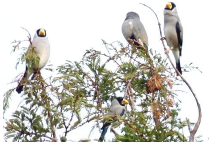
メンドヤの樹上にいるカの群れ