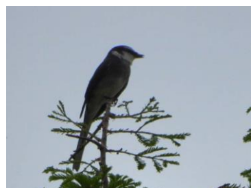
リュウキュウサンショウクイ