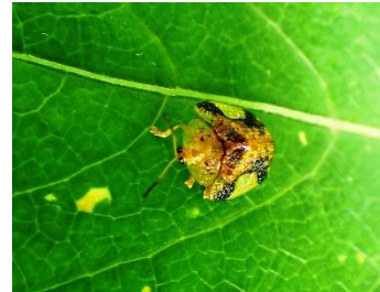
ヨツモンカメノコハムシ