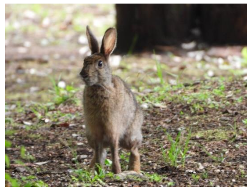
久しぶりに現れたノウサギ