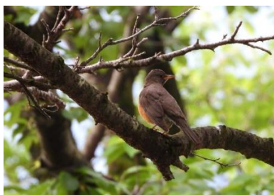
アカハラがやってきた