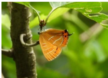
産卵中のアカシジミ