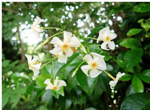
ティカカズラの花

暖かくなるにつれて、多くの生き物たちの活動も活発になってきました。シカやタヌキのフンも多くみられます。昨年も村を訪れて私たちを楽しませてくれたキビタキの姿も見られるようになりました。色々な生き物たちの様々な営みが見られるふれあいの村は、今、多くの生命に溢れています。(袖山)