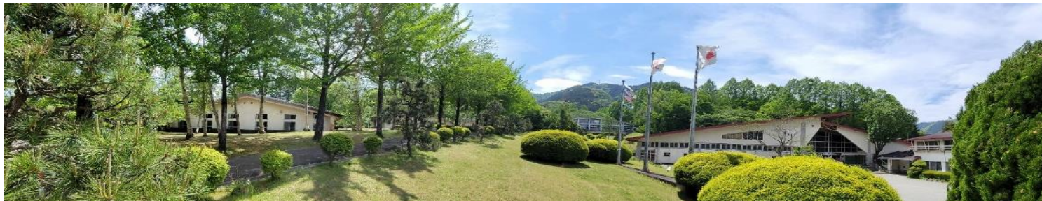
愛川ふれあいの村 今月の風景