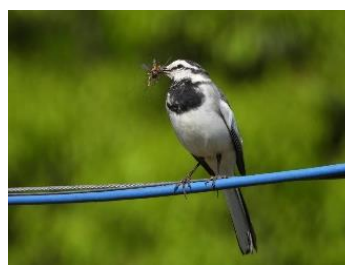
ハクセキレイ子育て中