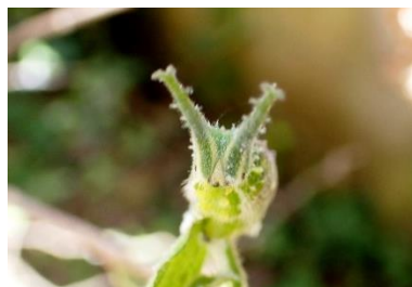
アカボシゴマダラ幼虫