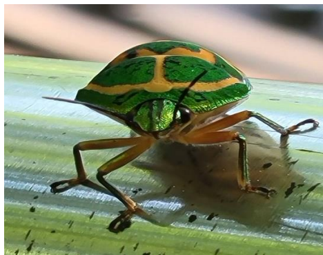
アカスジキンカメムシ